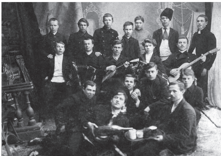
Ювелиры села. Декабрь, 1914 г.