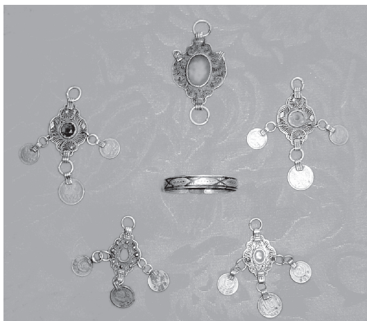
Изделия рыбнослободских ювелиров. Серебро. 1913 г.

С 26 января по 24 июня 1914 года художественная мастерская училища приняла участие на выставке работ учеников ремесленных мастерских Казанского губернского земства во время заседания Губерн-