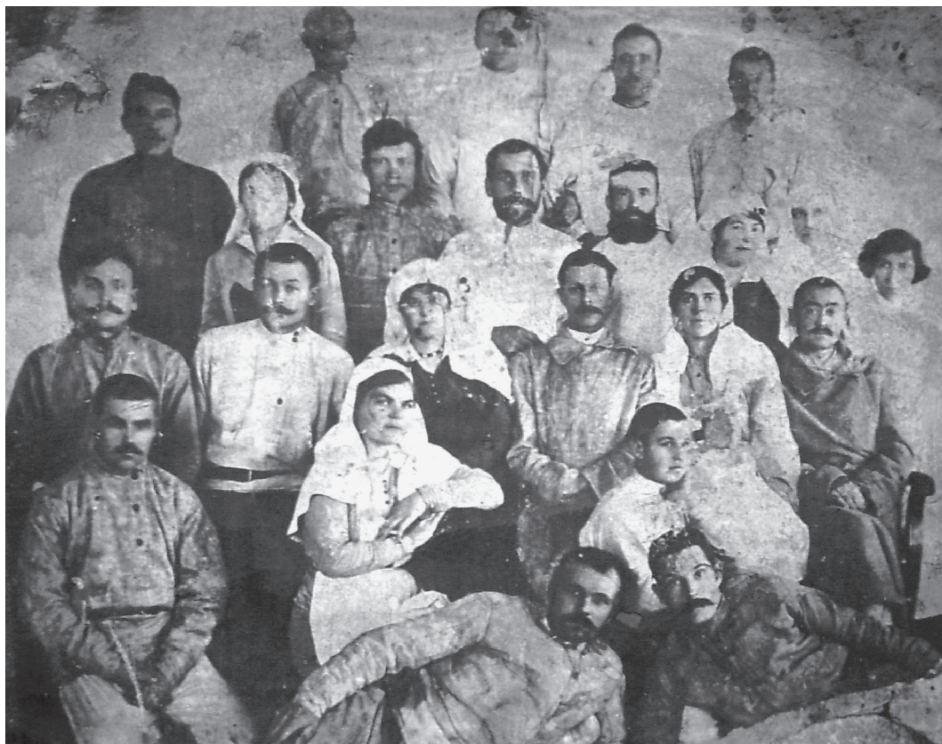
Военный госпиталь. 1919 г.