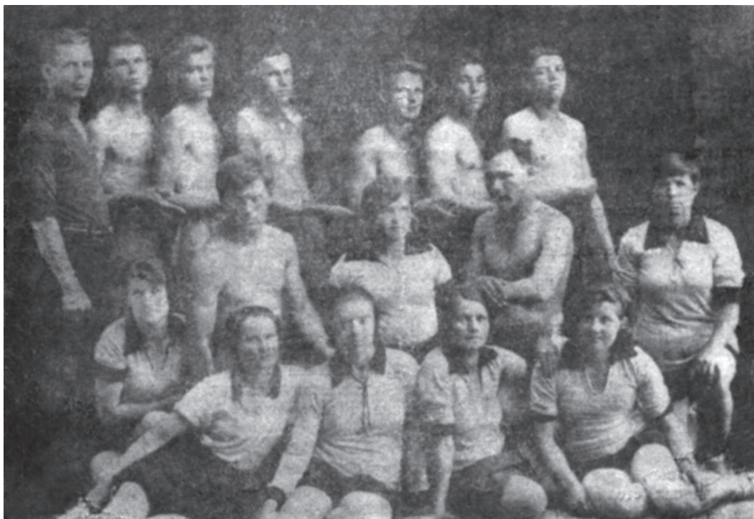
Команда по волейболу 1927–1928 гг. Фото из газеты «Путь Октября». Октябрь, 1978 г.

Особое внимание комсомол уделял развитию спорта.