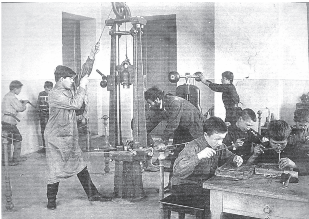
Художественная мастерская. Чеканное дело. 1911 г.

В 1913 году в помещении мастерской училища была организована выставка. Выставку посетил казанский губернатор. Он высоко оценил работу училища и мас-