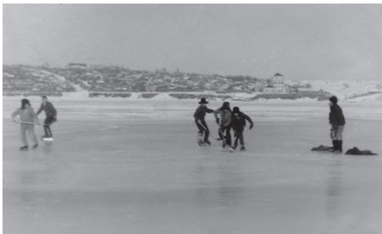
Зимой на Каме. 1960-е гг.

Каме. Он очень любил реку. Эта любовь передалась и мне.